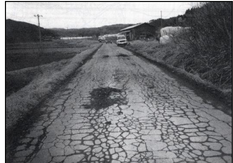
舗装剥離による穴