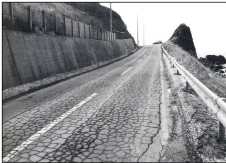
舗装面の亀甲状クラック