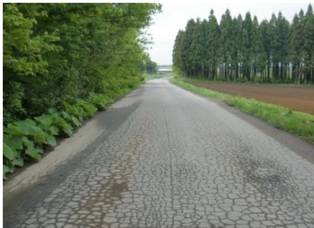
【青森県】町道中村・大池線(東北町)