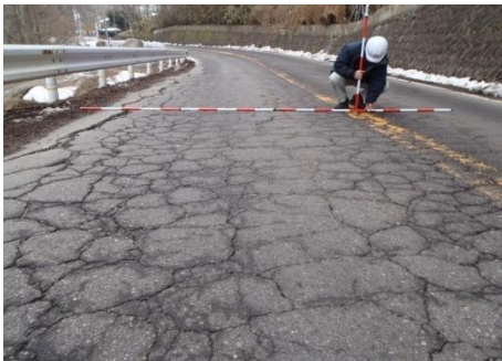
【長野県】国道144号(上田市管平)