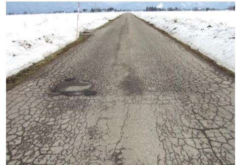
【秋田県】市道水上村杉線(大仙市)