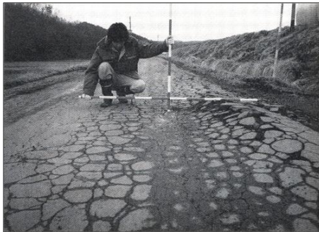
舗装面の盛り上がり、沈下