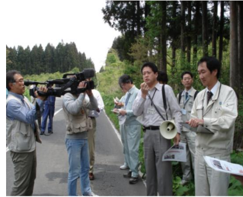
現地講習会の実施状況